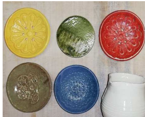
Farbmuster für fertige Eierbecher